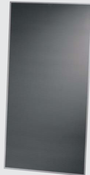
Solarmodul der Serie FS 2