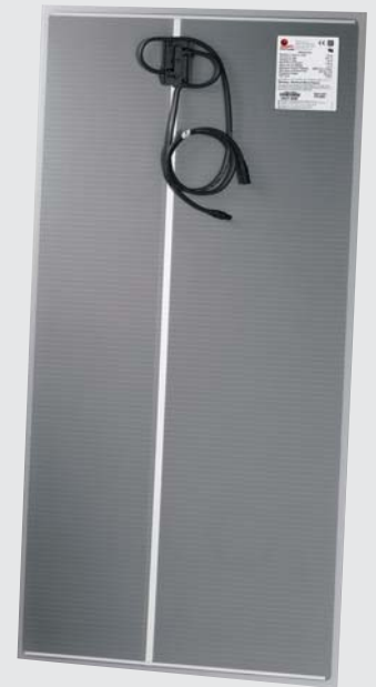
Solarmodul der Serie FS 2